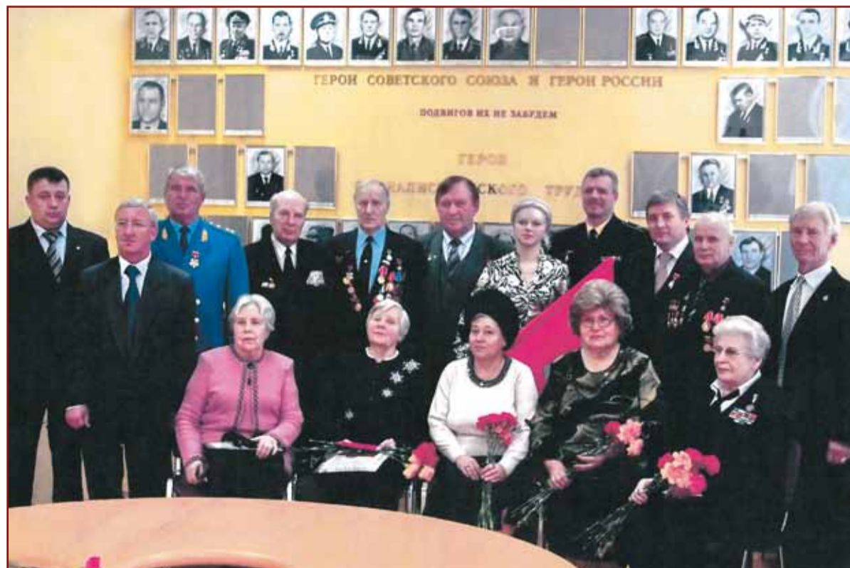
Открытие галереи «Боевая и трудовая доблесть Камчатки» в Доме Дружбы г. Петропавловска-Камчатского, 2008 г.

Работа ведётся большая, и строительство мемориала, прославляющего боевые и трудовые подвиги камчатцев, станет одним из её знаковых этапов.