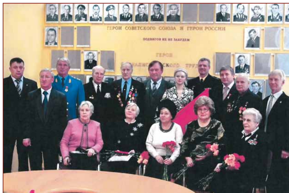
Открытие галереи «Боевая и трудовая доблесть Камчатки» в Доме Дружбы г. Петропавловска-Камчатского, 2008 г.

Работа ведётся большая, и строительство мемориала, прославляющего боевые и трудовые подвиги камчатцев, станет одним из её знаковых этапов.